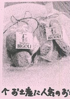
お土産に人気のあかし